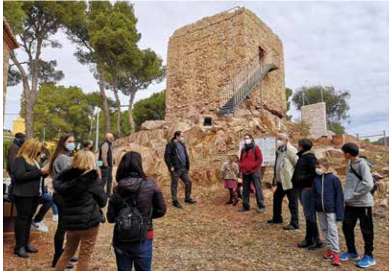
Es poden concertar visites guiades gratuïtes a la Tourist Info, als baixos del edifici consistorial

La peculiaridad de la edificación es la utilización de la técnica de doble aguja para fabricar encofrados usados para construir los tapias. Una característica que solo comparte con otra torre en la provincia de Valencia. ■