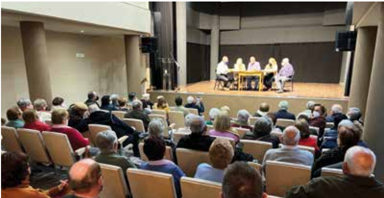
L'espai ja ha albergat les primeres activitats, com la reunió dels jubilats de primers de març.