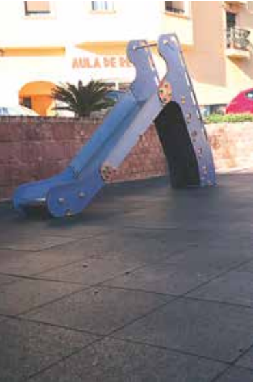
Adecuación y mantenimiento de espacios

El consistorio ha renovado el suelo con nuevas losetas de caucho y parte del mobiliario de juegos de la zona infantil de la plaza de la Font, al tiempo que se ha hecho mantenimiento al resto de mobiliario. ■