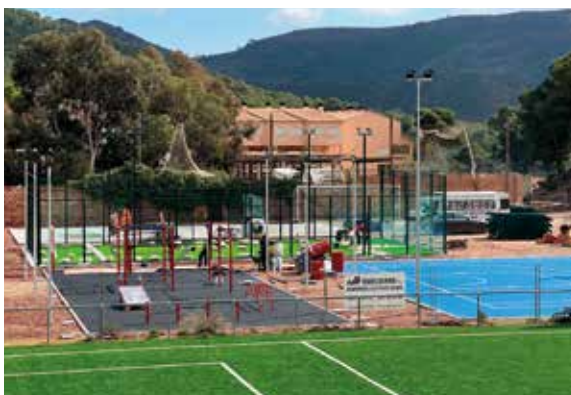
Los trabajos tienen un periodo de ejecución de 4 meses.

La actuación, valorada en 232.536,07 €, está financiada con los fondos del Plan de Inversiones de la Diputación de València