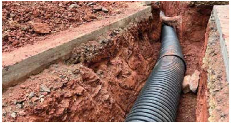
En octubre de l'any passat van començar el treballs d'acondicionament de la canonada

El Plan de Actuación Municipal frente al Riesgo De incendios forestales (PAMIF) ya tiene el visto bueno de la Agencia Valenciana de Seguridad y Respuesta a las Emergencias. El documento recoge el protocolo de actuación de las unidades municipales implicadas ante una emergencia de este tipo en nuestro pueblo. Dentro del plan se realizará formación específica para todas las personas implicadas. ■