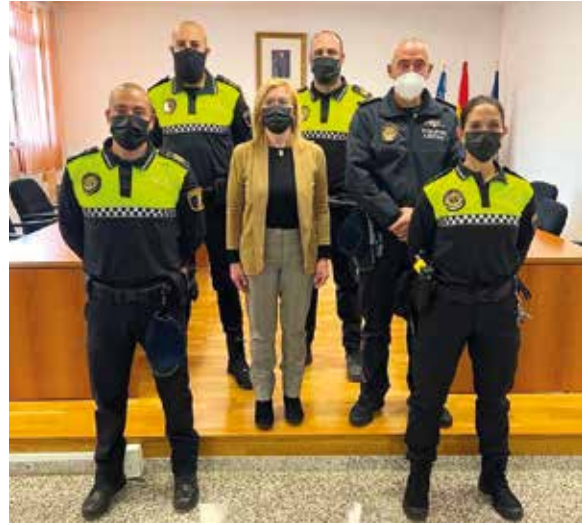
Recepció dels nous agents el passat 15 de febrer

«Treballem per fer de Serra un poble més segur amb un cos policial que done un millor servei a la ciutadania i cobreixca les 24 hores del dia.»